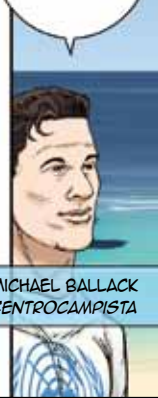
MICHAEL BALLACK CENTROCAMPISTA