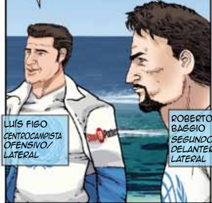
LUÍS FIGO CENTROCAMPISTA OFENSIVO/ LATERAL

NECESITAREMOS UN REFUGIO RÁPIDAMENTE POR SI EMPEORA EL TIEMPO.